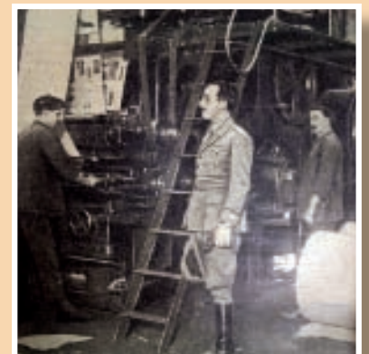
El comandante de la legión Don Francisco Franco visitó los talleres de ABC el 22 de febrero de 1922.

Pero más allá de las coloridas ilustraciones, los vientos cambian en el panorama político de los años 30. El 14 de abril de 1931 se proclama la II República y el monarca abandona España. ABC da cuenta de ese período convulso con artículos y fotografías. En una de ellas muestra a los bomberos colocando carteles en los muros del Palacio Real pidiendo a los ciudadanos que respeten el edificio. En otra fotografía se nos muestra a un Alfonso XIII sonriente a su llegada a Francia... En un editorial el diario ABC deja muy clara, desde el principio, su postura ante la recién