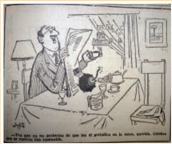
Primera viñeta de Antonio Mingote para ABC.