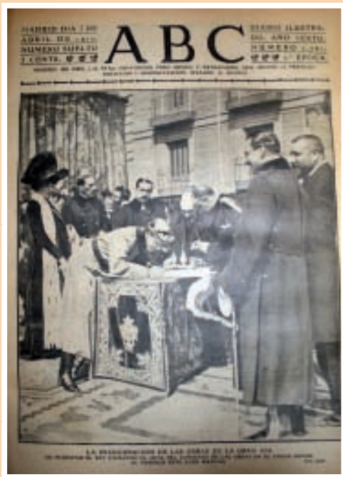
Inauguración de las obras de la Gran Vía por el rey Alfonso XIII. ABC (05 de abril de 1910).

—¿Cómo se llama su padre de usted?— le preguntaban a un señor, tomándole una declaración.