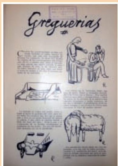
Gómez de la Serna publicó sus greguerías junto a dibujos hechos por él en las páginas de Blanco y Negro . Blanco y Negro n° 2146 (10-07-1932).