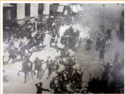
Atentado contra Alfonso XIII el día de su boda el 31 de mayo de 1906. Es la primera gran exclusiva gráfica del diario.

ABC , año VII, n.º 505, (01 de junio de 1906).