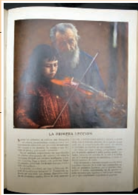
"La primera lección". La primera fotografía en color aparecida en la prensa española. ABC, año XXII, n° 1096 (12 de mayo de 1912).