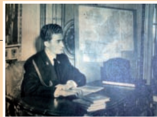
El príncipe don Juan Carlos consagrado al estudio en el palacio del duque de Montellano.