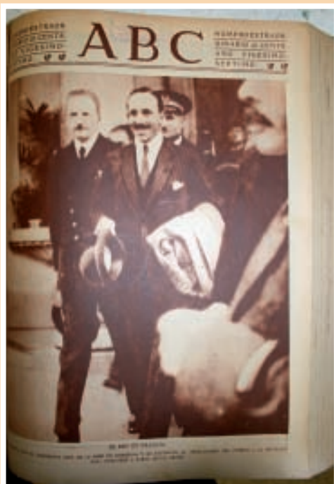
Alfonso XIII a su llegada a Francia.