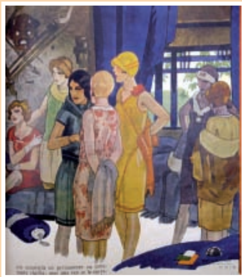
Rafael de Penagos fue uno de los fantásticos ilustradores que colaboraron en Blanco y Negro en los años 30.